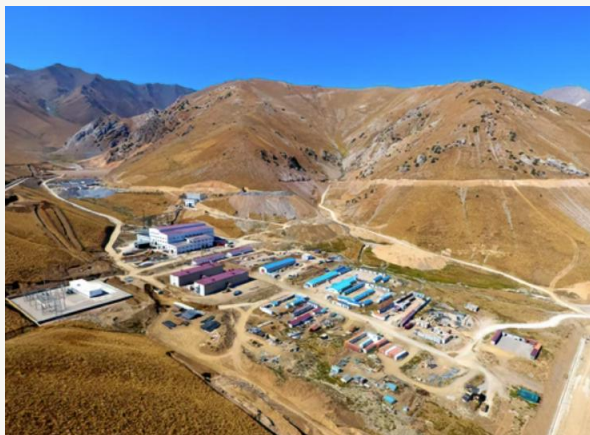
吉尔吉斯斯坦库鲁-捷盖列克矿