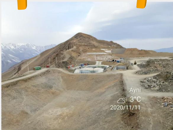
塔吉克斯坦库河东金矿氧化矿