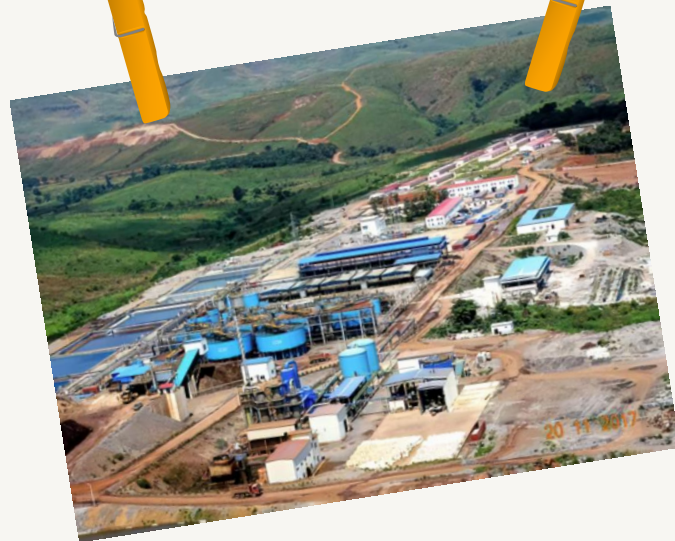
刚果(布)黑角索瑞米多金属矿